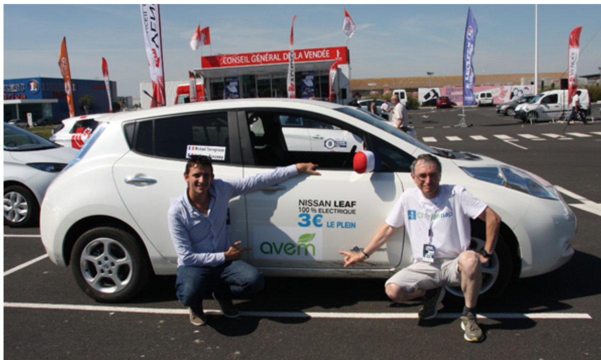
Vendée Electrique Tour – Notre traversée en Nissan Leaf – 167 km sans recharge !

Posté le 24/06/2014 à 12:20 par Michaël TORREGROSSA - Lu 299 fois - Poster un commentaire